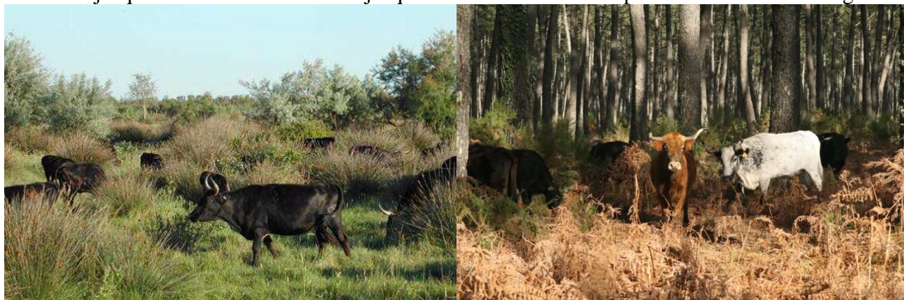
Les vaches sont élevées en semi- liberté

Les vaches également appelées « coursières » sont plus ou moins cotées selon leurs qualités combattives. Elles sont conduites aux arènes, puis enfermées dans des boxes appelées loges. Une corde est installée autour de leurs cornes afin de pouvoir les placer lors du combat dans les arènes. Les vaches de combat sont des femelles des taureaux de corrida, elles sont élevées en semi-liberté pour maintenir leur caractère sauvage et leur instinct offensif. En général, elles sortent pour la première fois dans l'arène à 3 ou 4 ans, poursuit sa carrière jusqu'à 13 ans et vit jusqu'à 20 ans. Elles pèsent entre 300 Kg et 400Kg,