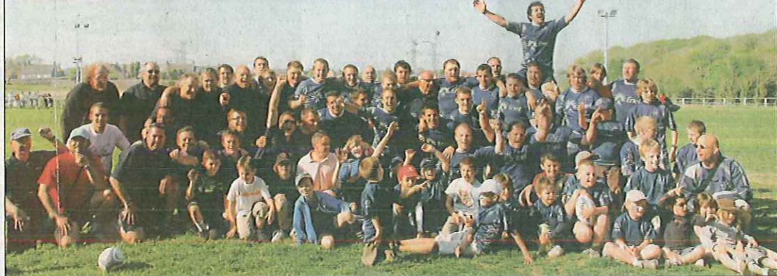
Belle communion à l'issue du match entre les rugbymen flamanvillais et leurs nombreux supporters.

Les Flamanvillais ont remporté leur demi finale grâce à une première mi-temps où ils ont dominé dans tous les secteurs de jeu.