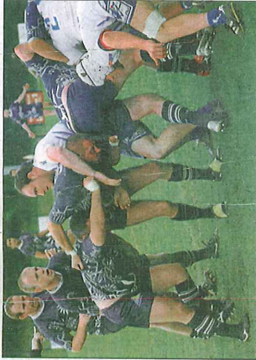
Les Haguais du ROC Flamanville ont su faire front pour remporter la victoire et devenir ainsi champions de Normandie Honneur.