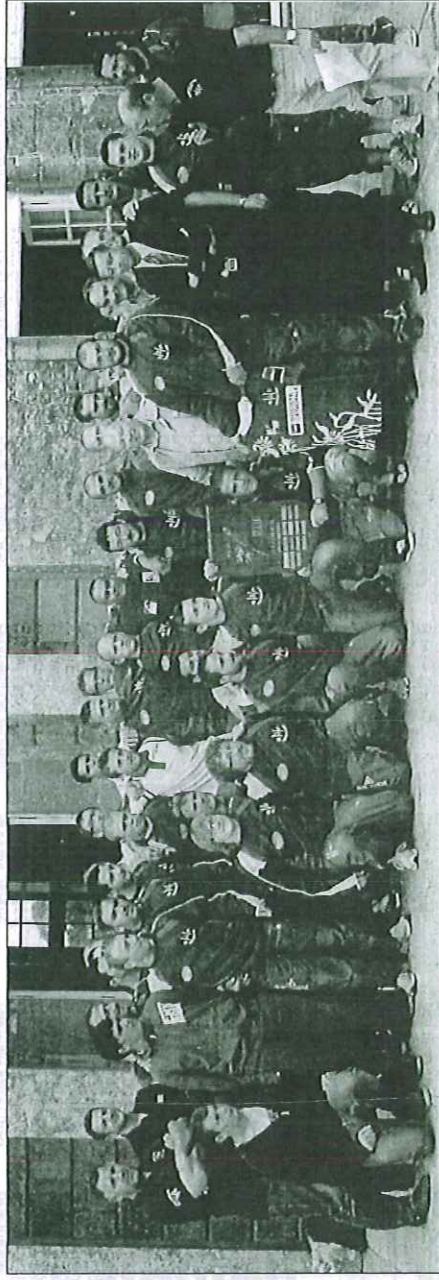
L'équipe première a reçu de nouveaux maillots offerts par la Société Générale.

L'équipe des juniors de l'entente NordCot (Cherbourg, Valognes, ROC) vient d'être dotée d'un jeu de maillots or-