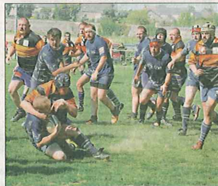
Auteurs notamment d'une énorme première période, les locaux se qualifient pour la finale du championnat de Normandie honneur. Chapeau !